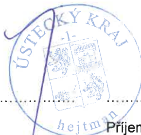
Poskytovatel Ústecký kraj Oldřich Bubeníček, hejtman kraje