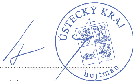
Poskytovatel Ústecký kraj Oldřich Bubeníček, hejtman kraje